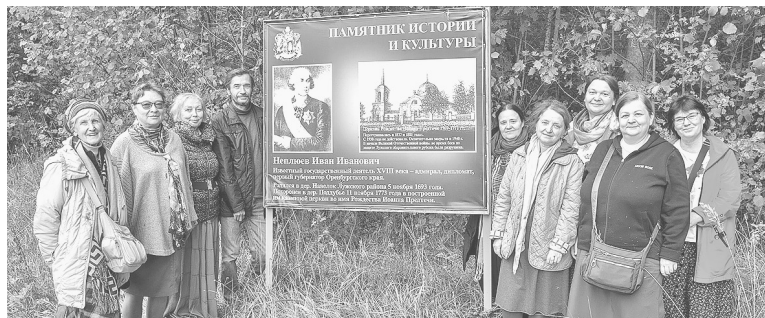
■ Московские паломники в дер. Поддубье

Гости пообщались с лужскими краеведами, побывали на родине нашего выдающегося земляка, адмирала, государственного деятеля и основателя Оренбурга Ивана Ивановича Неплюева (1693-1773) в деревне Наволок и в деревне Поддубье Ретюнского СП, где находилось родовое имение И.И. Неплюева и сохранились руины построенного им в 1767-1772 годах