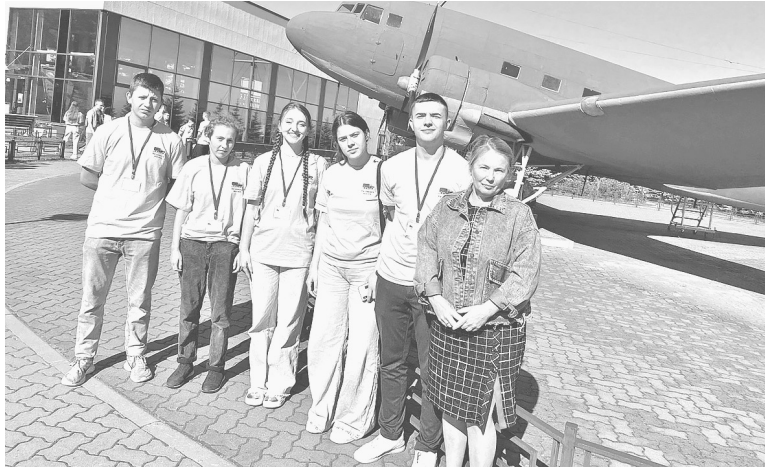
Делегация агропромышленного техникума на слете активов студенческого самоуправления «По дороге жизни»

Радует, что сегодня учиться в колледжах и техникумах престижно, что у молодежи есть интерес к реальным практическим знаниям и навыкам, которые пригодятся в жизни и профессиональной деятельности.