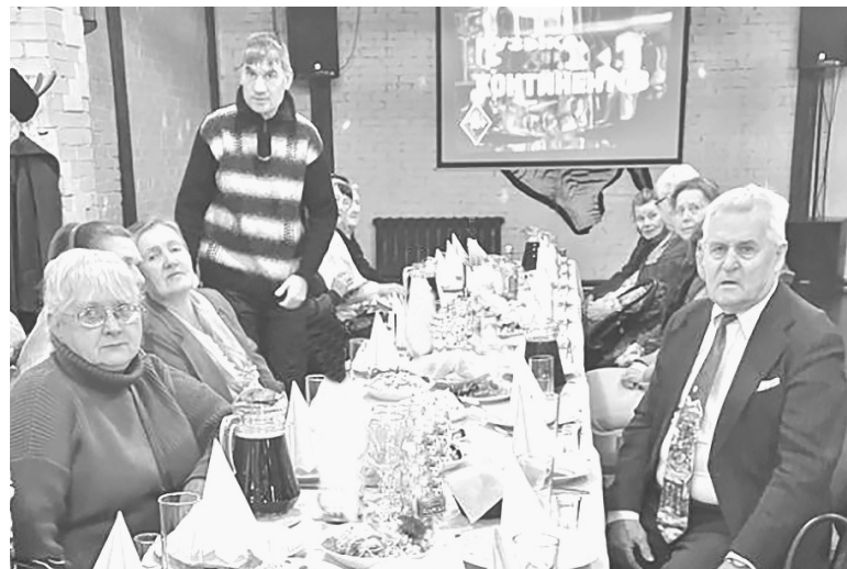
На одном из мероприятий