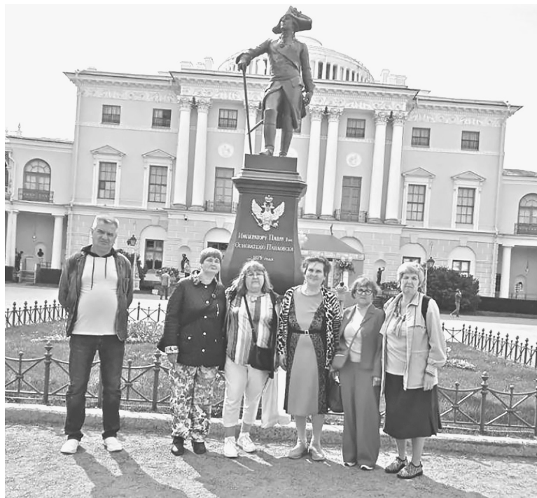
Экскурсия в государственный музей-заповедник Павловск

С ее жизнерадостным характером и открытой душой это удается. Если человек унывает, не видя впереди ничего хорошего, она умеет его встряхнуть, заставить задуматься о жизненных возможностях, что-то подсказать. Рассказывает об одном из членов Общества, который, будучи инвалидом, окончил 11 классов вечерней школы, а потом университет. Все эти годы он благодарил председателя Общества за то, что поддержала в трудный момент, наставила на путь истинный. К несчастью, болезнь все-таки победила.