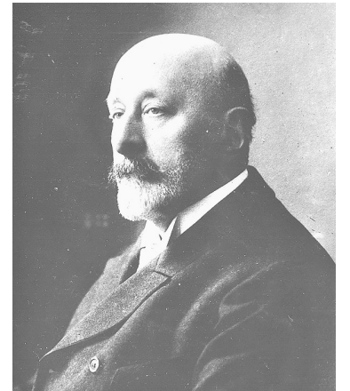
■ Н.Н. Неплюев

ная правнуку адмирала – Николаю Николаевичу Неплюеву (1851-1908) и основанному им в 1889 году Крестовоздвиженскому трудовому братству в Черниговской губернии. Несмотря на то что это братство было окончательно уничтожено властями в 1929 году, его члены продолжали собираться на встречи вплоть до 1970 годов.