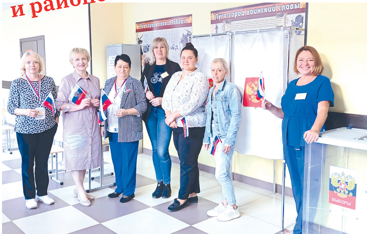
Торжественная, праздничная и доброжелательная атмосфера царила на избирательных участках Лужского района в дни голосования на выборах депутатов в органы местного самоуправления

В Луге и Лужском районе в течение двух дней проходили выборы в органы местного самоуправления. Наши фотокорреспонденты побывали на избирательных участках.