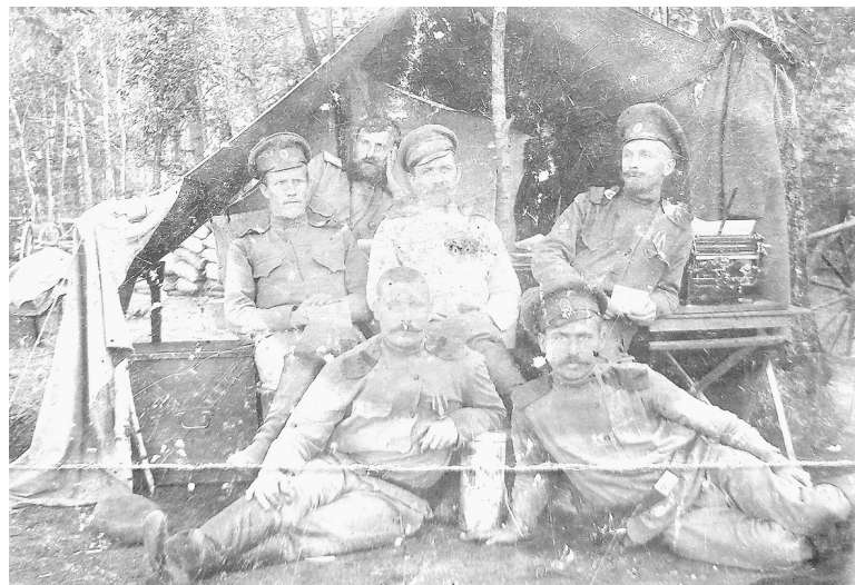
Фото В.В. Кустова, 10 августа 1916 г.