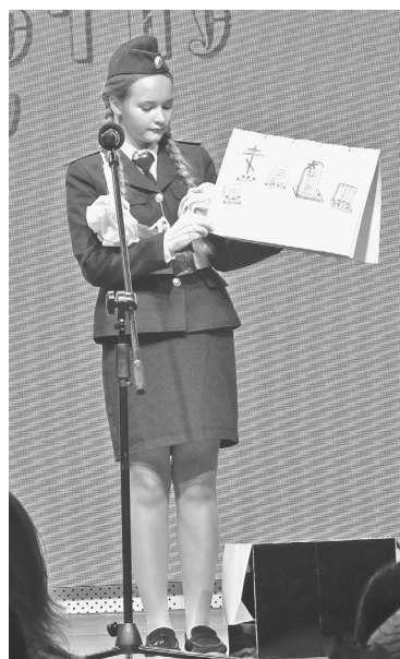
Выступает команда школы № 4

ников игры. Диплом за артистизм получила команда «Охотники за удачей» школы № 5. Команда школы № 4 была отмечена за креативность, а награду за лучшую подготовку декораций и реквизита заслуженно получила Толмачевская школа 47