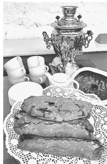
Знаменитый рыбник из Шлиссельбурга

подготовил Музей истории города Шлиссельбурга — «Гастрономический вояж».