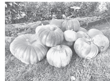
■ Вот такой получился урожай

Урожай получился знатный – более десятка тыкв разного размера и цвета выросло, будет чем угостить друзей и знакомых.