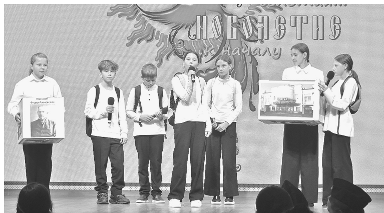
Выступление команды школы № 5