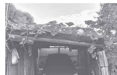
■ Внизу – автомобиль, сверху – тыквы

Естественно, поначалу растение было посажено в грядку на земле. Когда стебель подрос, его перекинули на крышу гаража. Стебелек потянулся и пошел в рост, постепенно крыша превращалась в целое тыквенное поле. Удивляться тут нечему – условия на крыше почти идеальные: тепло от щедрого солнышка, в меру мокро от дождей, и никаких сорняков.