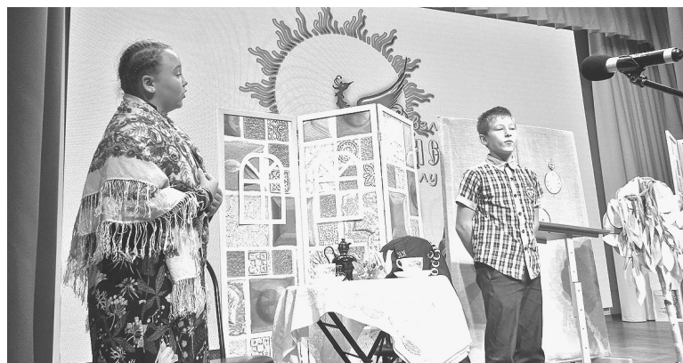
Выступление команды Толмачевской школы