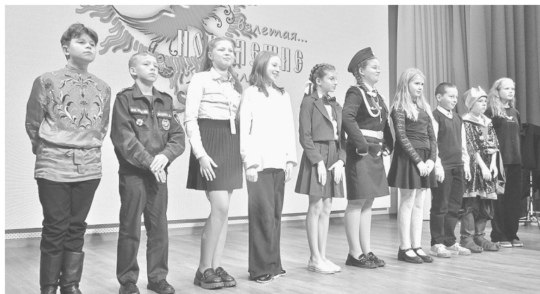
На сцене – капитаны команд

Команда Толмачевской школы имеет свой узнаваемый почерк: в очередной раз она порадовала зрителей те-