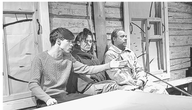
В Выре сцену артистам заменило пространство деревянного дома

АЛЕКСАНДРА СИДОРОВА