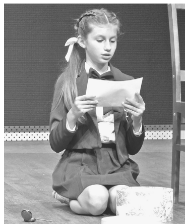
Выступление команды школы № 3

В холле второго этажа Лужской межпоселенческой районной библиотеки открыта выставка, посвященная 150-летию Николая Рериха.