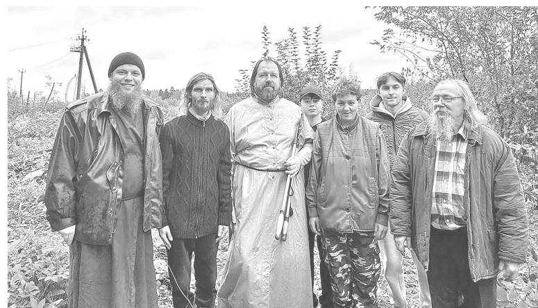
Участники архиерейского субботника

Это не первый субботник в монастыре, который возглавляет правящий архиерей, где он трудится со всеми наравне. В этот раз участники мероприятия занимались благоустройством территории обители и ликвидацией сорной поросли и кустарников. Отметим, что архиерейские субботники в Череменецком монастыре уже стали хорошей традицией и способствуют его дальнейшему возрождению.