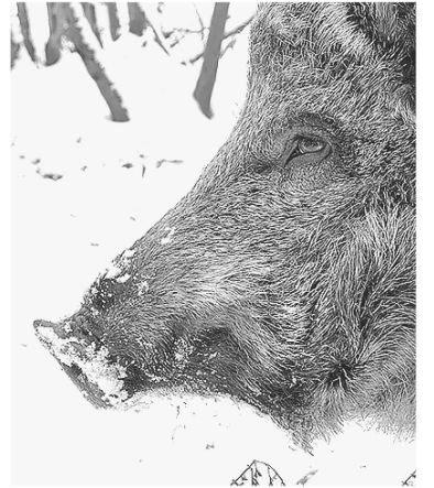
■ Дикие свиньи живут в Ленобласти с 1947 года