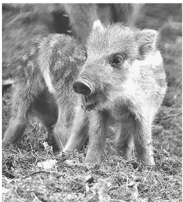
■ Кабаны — самые плодовитые животные среди копытных

О присутствии этих животных в лесу мы узнаём по участкам земли, которые перепаханы, словно трактором. За день один кабан при помощи своего ловкого и сильного рыла может вспа-