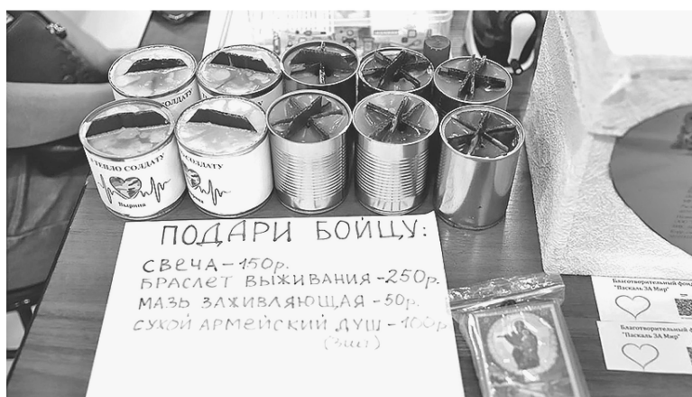
Благотворительная ярмарка в поддержку защитников Отечества в п. Новоселье