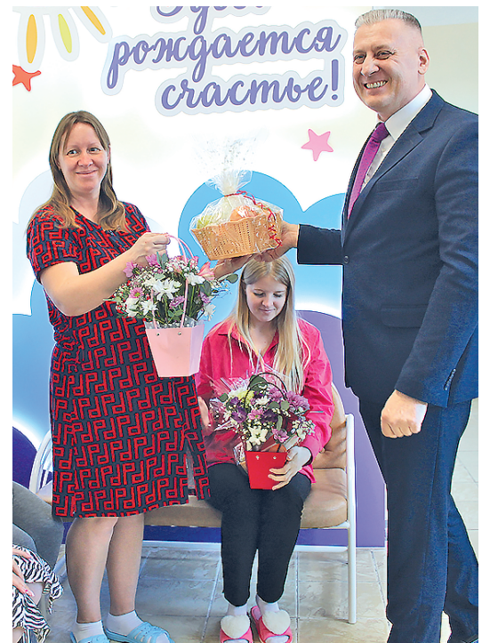
По проекту «Крепкая семья» в нашем городе впервые прошел День беременных. Подробнее - на 3 странице.