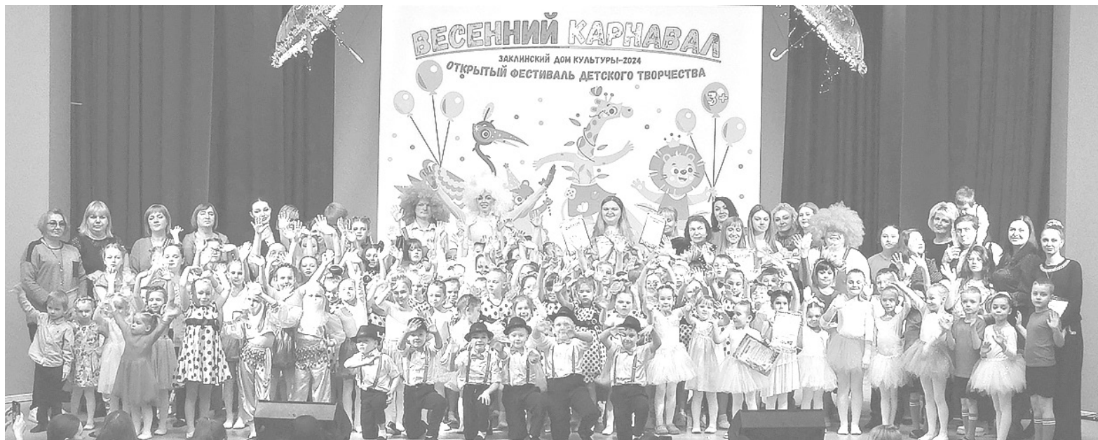
❶ Все участники фестиваля детского творчества «Весенний карнавал»

Все номера заслуживали громких аплодисментов. А участники очень старались выступить как можно лучше, чтобы их номера запомнились.