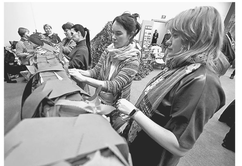
Женщины на мастер-классе по изготовлению маскировочных сетей