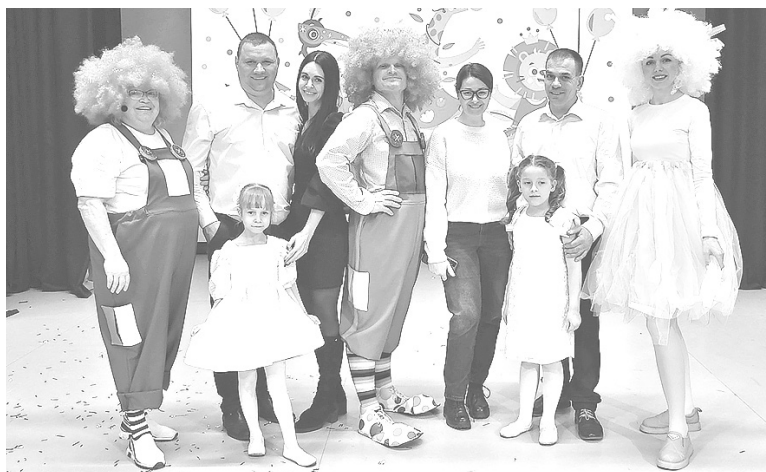
❹ Ведущие мероприятия с участниками семейных номеров