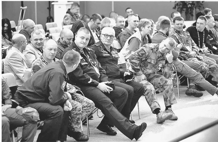
Участники Ассоциации ветеранов специальной военной операции Ленинградской области

ОБЩЕСТВЕННЫЕ ОРГАНИЗАЦИИ ЛЕНИНГРАДСКОЙ ОБЛАСТИ ПОДДЕРЖИВАЮТ УЧАСТНИКОВ СПЕЦОПЕРАЦИИ И ИХ СЕМЬИ