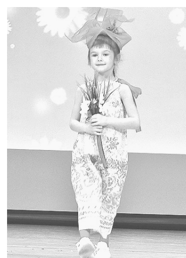
❸ Толмачевский «Театр моды»