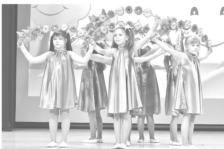
❷ «Вальс цветов» от воспитанников детского сада № 4

А в Заклинском Доме культуры уже начинают готовиться к следующему значимому мероприятию – районному конкурсу детского творчества «Уроки Победы», который состоится 4 мая 47