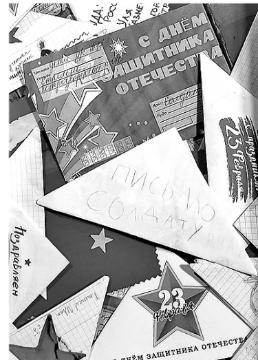
Письма бойцам от детей Ленобласти