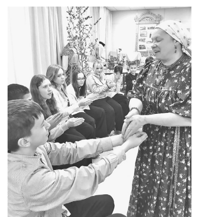
Играем в народные игры

Ребята играли в ремешок, в ворота, получили опыт взаимного общения в пляске «Бегала лисичка». Девушки учились владеть платочком, а парни в пляске пытались его забрать.