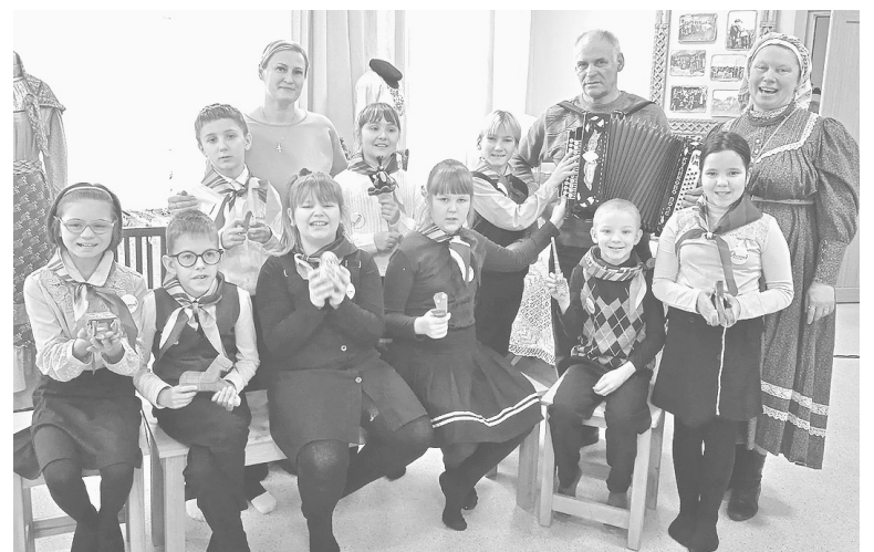
На занятии интересно и весело

А ученики 7 класса Лужской санаторной школы-интерната выбрали для занятия