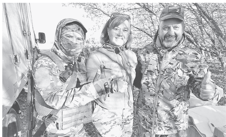
Волонтеры из Гатчины во время поездки на передовую

ЮЛИЯ ЛИСНЯНСКАЯ ФОТО: «ФРОНТОВОЙ ОБЕД-47»