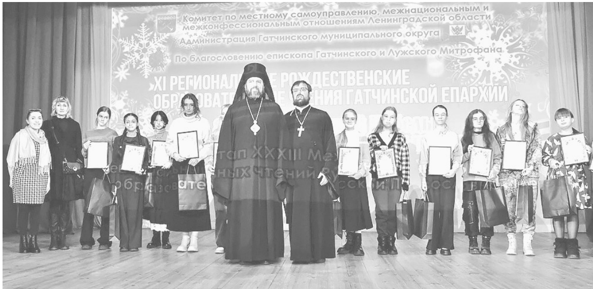
Победители конкурса детского творчества