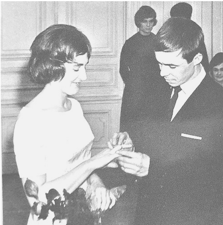
❶ Свадебные кольца покупали в складчину