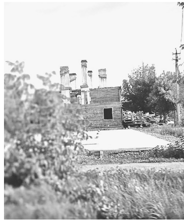
📷 Жители этого дома уже получили новые квартиры

планируется расселить еще более 41 тыс. кв. м аварийного жилья, из 2,6 тыс. жителей большая часть получит квартиры в новых домах в Сясьстрое, Рошине, Луге, Вознесенье, Пустомержском и Винницком сельских поселениях.