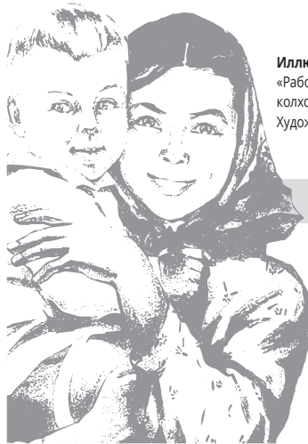
Иллюстрация: Фрагмент плаката «Работают матери, спорится труд – колхозные ясли детей берегут». Художник Н. Ватолина. 1955 год

Официальным праздником день 27 сентября стал считаться с 2016 года, когда было принято соответствующее распоряжение Правительства России.