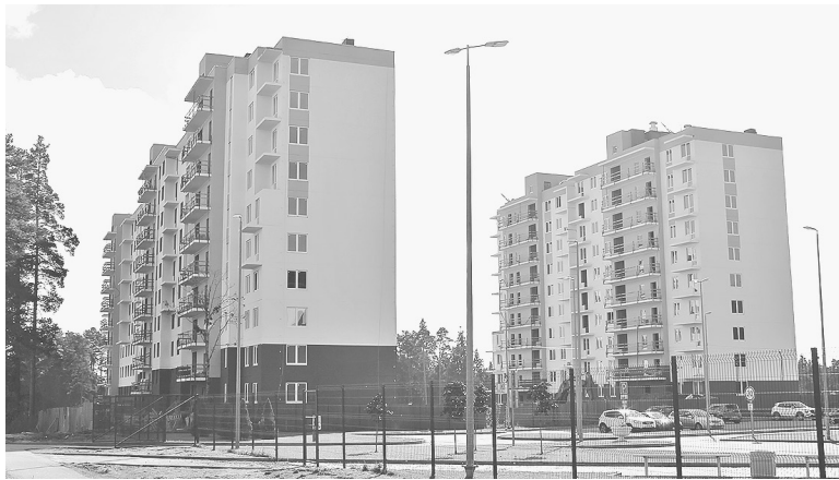
📷 Фотография сделана 20 сентября 2024 г. Строительство домов идет активно

Пресс-служба губернатора и правительства Ленинградской области информирует: программа расселения аварийного жилья нацпроекта «Жилье и городская среда»