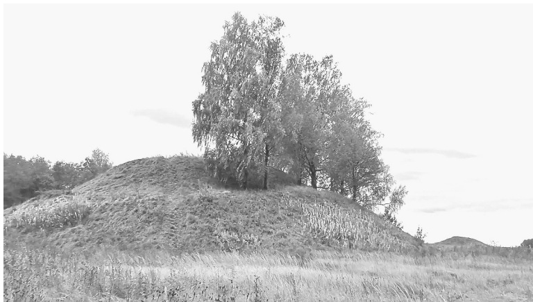
☉ Сопка Шум-гора

Передольский комплекс средневековых археологических памятников находится в Батецком районе Новгородской области, очень близко к границе с Лужским районом. Самый известный здесь объект – знаменитая сопка Шум-гора, одна из самых крупных в Восточной Европе и уникальная по своей конструкции. Высота сопки более 14 метров, и насыпана она в два яруса. Легенды называют ее могилкой князя Рюрика, но едва ли это так. Однако с уверенностью можно говорить, что это очень значимый памятник, смысл которого до сих пор не ясен, но внешний вид,