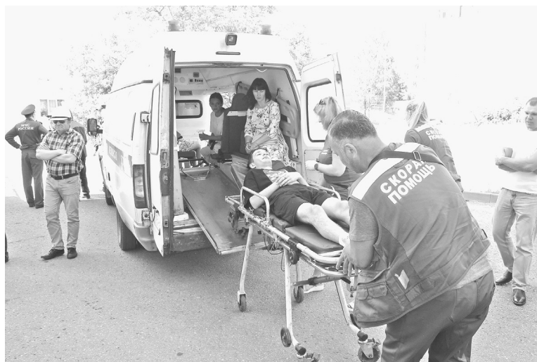
Помощь оказывают медики

зы, быстро протянули на четвертый этаж пожарные рукава и приступили к тушению очага «возгорания». Водоканал обеспечивал поступление воды в пожарные гидранты. На улице одна из пожарных машин протянула к окну «горящей» квартиры лестницу.