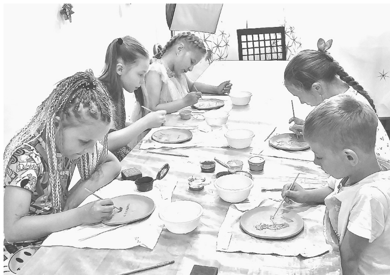
Мастер-классы в студии IRNIKA_pottery для детей и взрослых