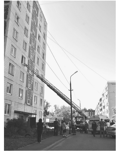
В квартире – взрыв» газа

«К сожалению, на территории нашей страны не редки случаи, когда люди непра-