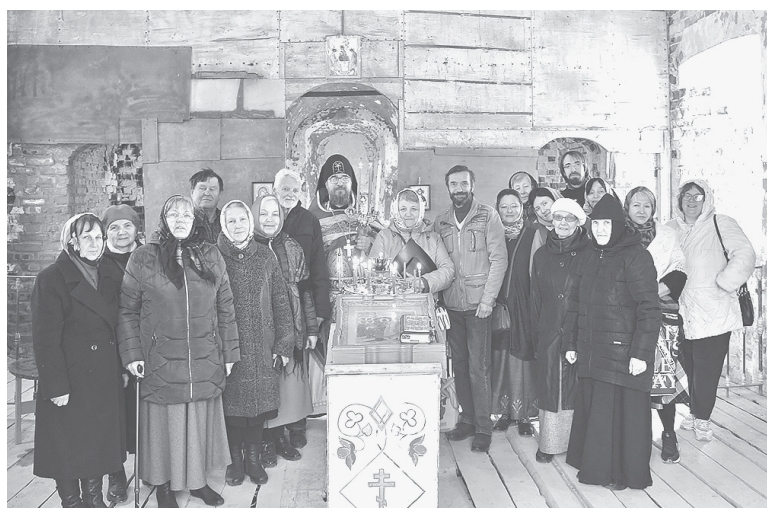
■ Праздник в Романщине

На Божественную литургию в Романщине, которую