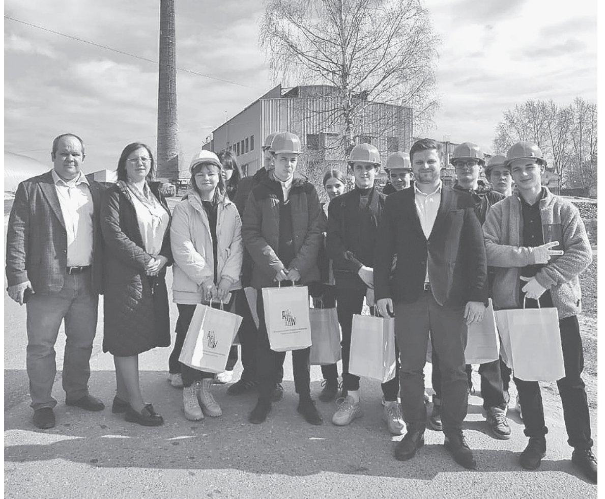
📷 Фото на память. Гости уедут с подарками

Для специалистов в области КИПиА на заводе «Петербургское стекло» есть