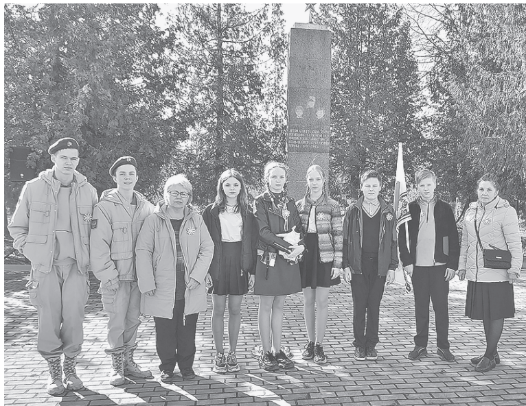
■ Лужские участники слета «Память Великой Победы»