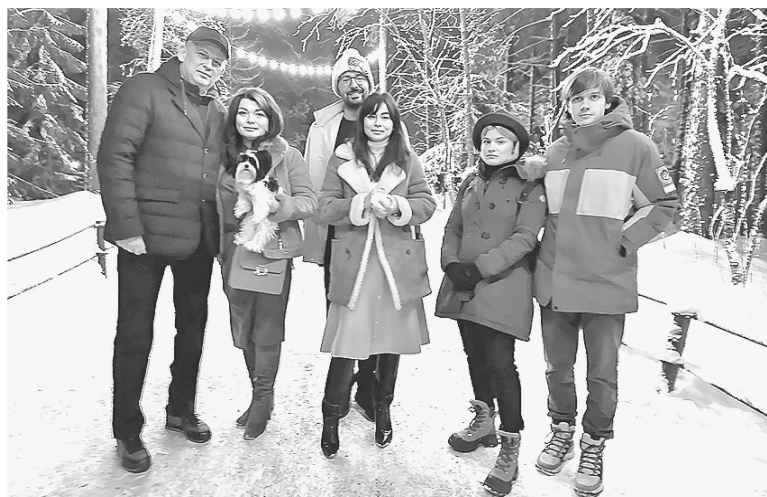
Губернатор Александр Дрозденко в семейном кругу

роны. Конечно, любим и художественную литературу, в том числе — популярные книги и детективы. Но чем отличается манера чтения Александра Юрьевича от моей манеры? Я книгами голову загружаю, а он — в силу рабочего ритма — разгружает. Придя домой с работы в режиме «нон-стоп» и многозадачности, он может взять какой-нибудь ис-