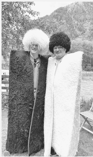
Если отдых — то на российских курортах

ЯРКИЕ МОМЕНТЫ ИЗ ЖИЗНИ АЛЕКСАНДРА ДРОЗДЕНКО