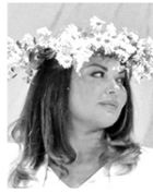
ОТРЫВОК ИЗ КНИГИ ИРИНЫ ДРОЗДЕНКО «МОЁ. ДУШЕВНАЯ ПУБЛИЦИСТИКА»

Говорят, что ничто не вечно, но я твердо верю в то, что для некоторых любовь живет даже после того, как они прекращают свой земной путь.