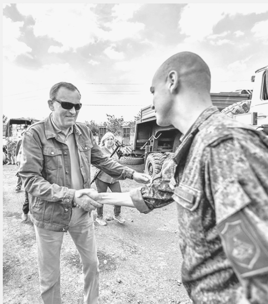
Бойцы в зоне СВО ценят поддержку губернатора