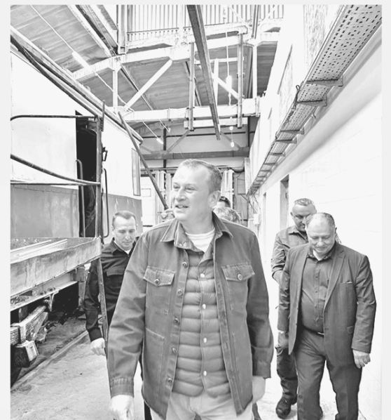
Ленобласть восстанавливает соцобъекты в подшефном Енакиеве