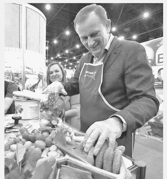
...но и закрутки на зиму может приготовить