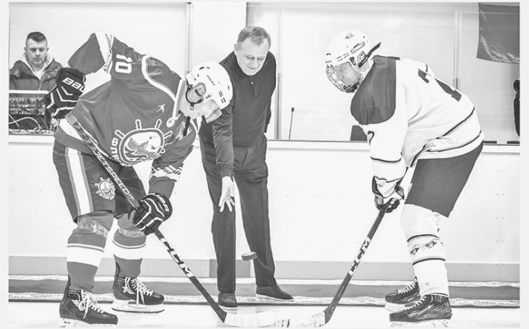
Александр Дрозденко на символическом вбрасывании шайбы в честь открытия Ледовой арены в Рощино