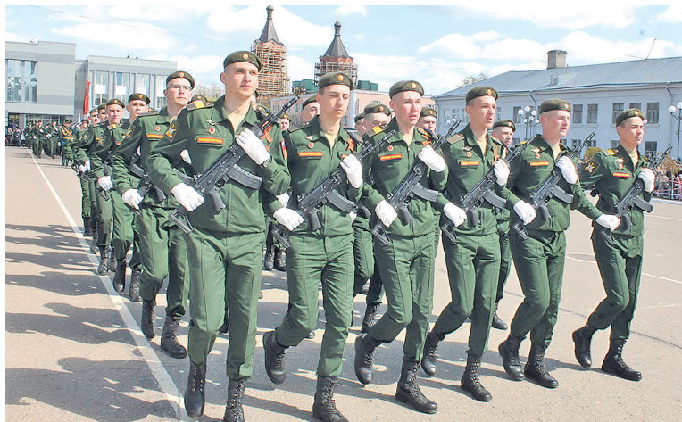
Военнослужащие срочной службы участвуют в торжественных шествиях в Луге, посвященных Дню Победы. Фото 9 мая 2024 года

Призывники не будут привлекаться к участию в выполнении задач специальной военной операции в новых регионах.