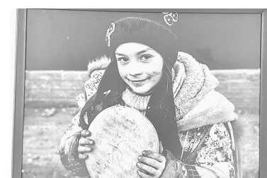
Фото Д. Григорюка «Девочка с буханкой хлеба». Весной 2022 года Даша с другими мариупольцами пряталась в подвалах от бомбежки. К дому, где они находились, приехали журналисты и бойцы ДНР. Они привезли продукты и дали Даше каравай, с которым и запечатлел ее фотограф.

он принял решение уйти добровольцем на фронт: «После мобилизации я решил, что должен защищать рубежи России. Я подписал контракт с батальоном «Тигр» и попал в разведотряд, где занимался анализом информации, полученной от дронов, радиоперехватом и пленных».