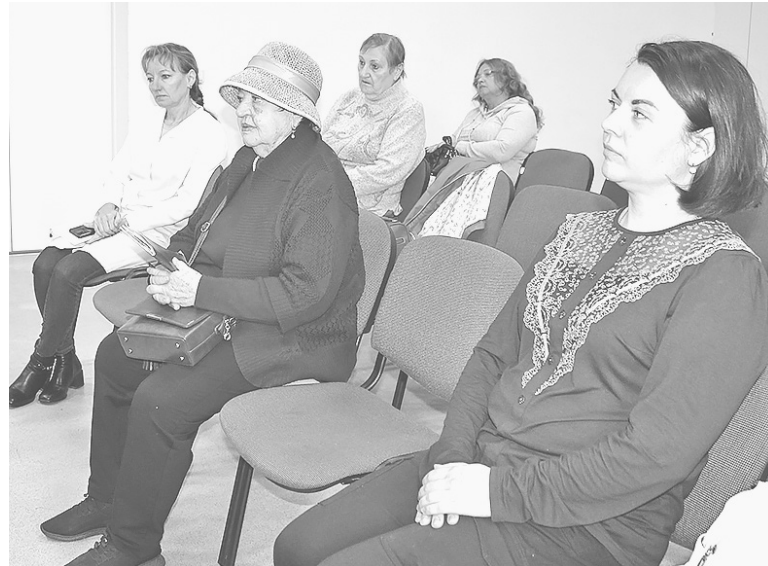
Жители, пришедшие на встречу

Вопрос лекарственного обеспечения федеральных льготников находится в зоне ответственности комитета по здравоохранению Ленинградской области. Есть определенный алгоритм закупки и расчета лекарственных средств для льготной категории граждан, это занимает какое-то время. Главврач по-