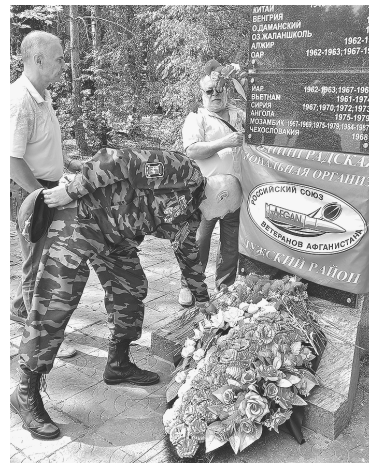
■ Возложение венков и цветов к памятнику воинам-интернационалистам