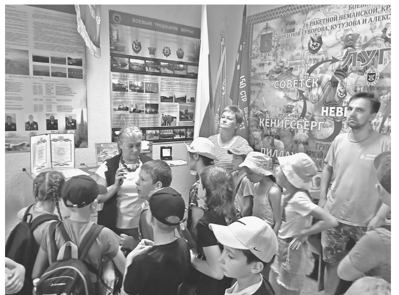
■ Экскурсия в комнате Боевой славы

Впечатлила детей скульптурная композиция в парке «Патриот», посвященная 30-летию Великой Октябрьской социалистической революции (автор Анатолий Николаев).